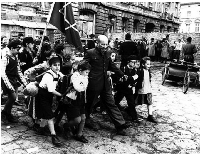
Der Marsch der Waisen in das Vernichtungslager Treblinka: Szene aus dem Film «Korczak» von Andrzej Wajda.