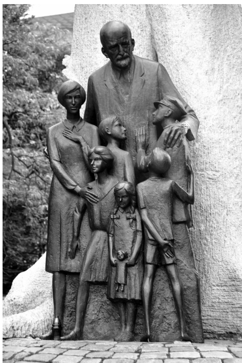
Denkmal für Janusz Korczak in Warschau.

Mensch zu respektieren und mit ihm zusammen für eine Humanisierung der Verhältnisse zu arbeiten, sich zusammen mit dem Kind zu bilden und zu erziehen».