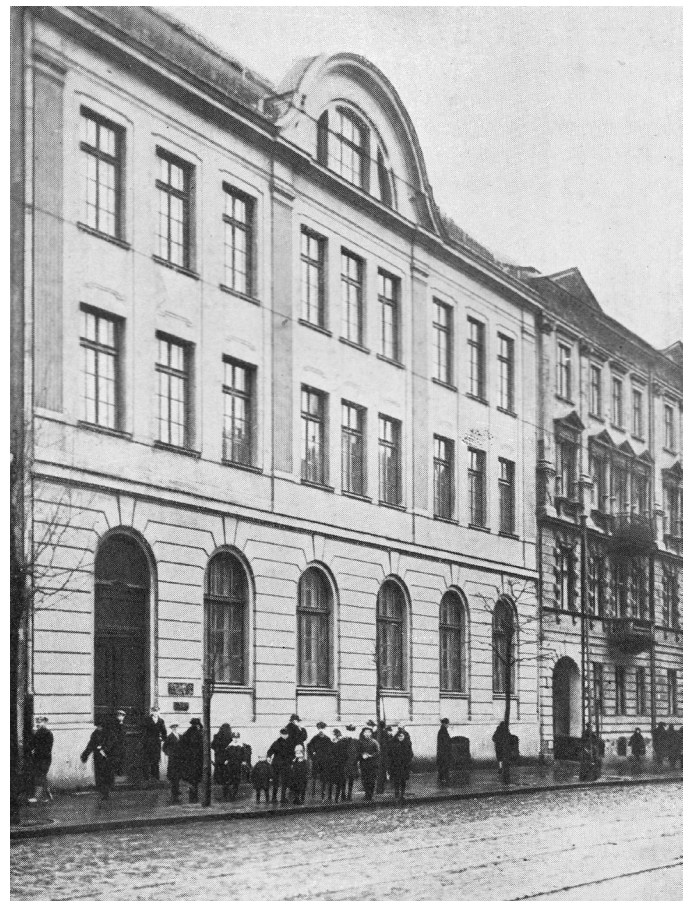
Das jüdische Waisenhaus Dom Sierot in Warschau um 1935.

Demgegenüber sind in herkömmlichen Erziehungskonzepten die Erziehenden den Kindern überlegen, oder in den Worten des polnischen Arztes ausgedrückt: «In Wahrheit ist unsere Beziehung zu Kindern eine geringschätzige, eine leichtfertige.» Nach ihm sollte ein Erzieher nicht die Gehorsamkeit des Kind anstreben, sondern sich bemühen, «das Kind als