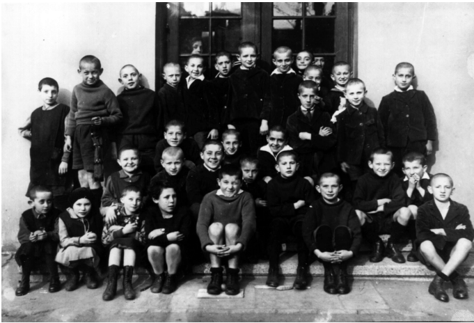
Einige Waisenkinder vor dem Haus 1939.