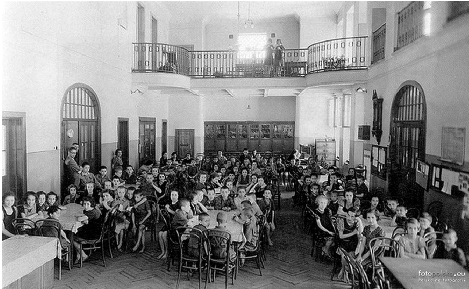
Kinder im Esssaal des Waisenhaus Dom Sierot im Jahr 1940.

Die Kinder hatten neben Rechten auch Pflichten. Neben dem Besuch externer Schulen übernahmen sie Aufgaben bei der Führung des Haushalts im Waisenhaus. Die Verteilung der Aufgaben wurde ausgehandelt: Die einen sorgten für Ordnung und Sauberkeit im Schlafsaal, andere in den Waschräumen oder im Schulzimmer. Bei Konflikten wurde das Gericht angerufen. Jedes Kind hatte das Recht auf Einspruch und auf Partizipation bei der Gestaltung des täglichen Lebens. So wurde das Kinderheim ein für die Zeit unüblicher Hort der Demokratie und der Selbstverantwortung. In ganz Polen berühmt wurden auch die Kinderzeitungen, die Korczak zusammen mit den Kindern produzierte und veröffentlichte.