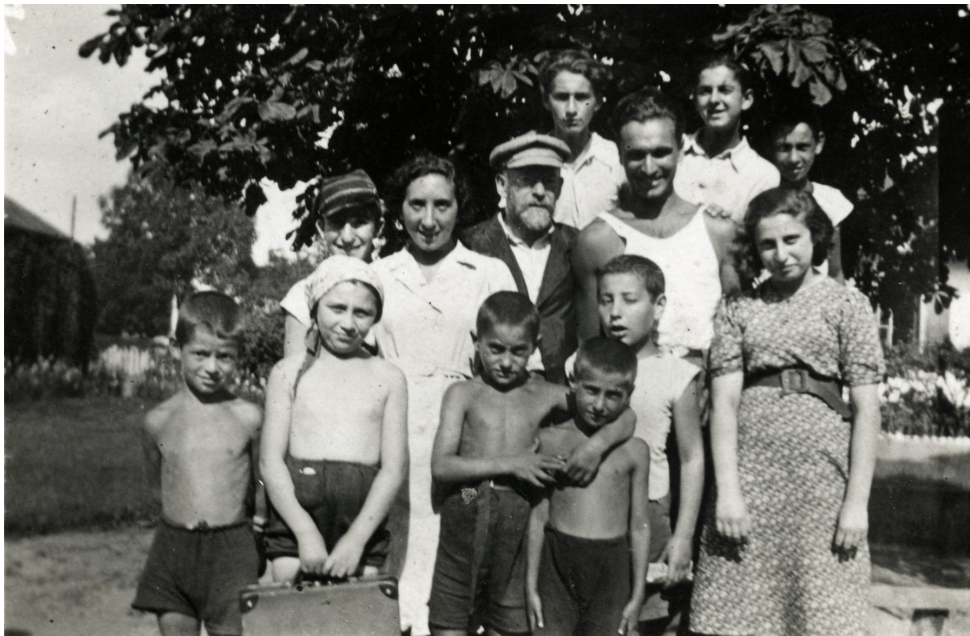
Janusz Korczak (mit Mütze) und seine Mitarbeiterin Stefania Wilczyńska (links von ihm) mit einigen Kindern seines Waisenhauses.

viele Beeren und Pilze gäbe. Er ordnete an, sich festtäglich zu kleiden und so hübsch herausgeputzt, in fröhlicher Stimmung, traten sie paarweise auf dem Hof an. Die kleine Kolonne führte ein SS-Mann an, der als Deutscher Kinder liebte, selbst solche, die er in Kürze ins Jenseits befördern würde. Besonders gefiel ihm ein zwölfjähriger Junge, ein Geiger, der sein Instrument unter dem Arm trug. Er befahl ihm, an die Spitze des Kinderzuges vorzutreten und zu spielen – und so setzen sie sich in Bewegung. Als ich ihnen an der Gęsia-Strasse begegnete, sangen die Kinder, strahlend, im Chor, der kleine Musikant spielte ihnen auf und Korczak trug zwei der Kleinsten, die ebenfalls lächelten, auf dem Arm und erzählte ihnen etwas Lustiges.»